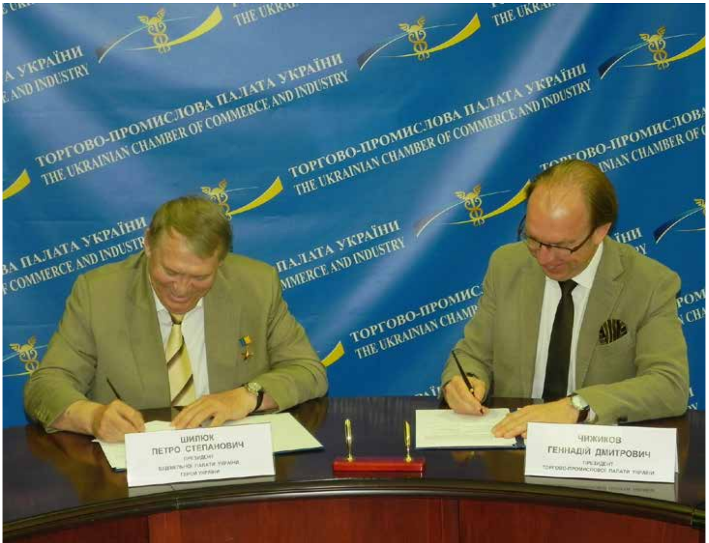
Фото: Президент Будівельної палати України, Герой України Петро Степанович Шилюк та Президент Торгово-промислової палати України Геннадій Дмитрович Чижиков під час підписання Договору про партнерство та співпрацю

Президент Будівельної палати України, Герой України Петро Степанович Шилюк підписав Договір про партнерство та співпрацю з Президентом Торгово-промислової палати України Геннадієм Дмитровичем Чижиковим.