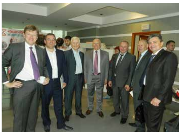
Фото - 2: Перший віце-президент Будівельної палати України Станіслав Телісфорович Сташевський (в центрі) з представниками делегацій із Республіки Білорусь та Литви