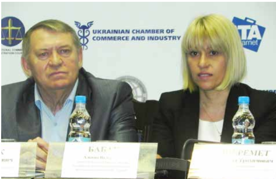
Фото - 1: Президент Будівельної палати України, Герой України Петро Степанович Шилюк та заступник голови Комітету Верховної Ради України з питань будівництва, містобудування і житлово-комунального господарства Альона Валеріївна Бабак у президії загальних зборів учасників Всеукраїнської спілки виробників будматеріалів

Президент Будівельної палати України, Герой України Петро Степанович Шилюк, Перший віце-президент Палати Станіслав Телісфорович Сташевський та члени президії Палати взяли участь у загальних збо-