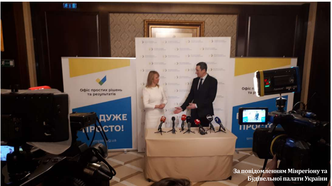
За повідомленням Мінрегіону та Будівельної палати України