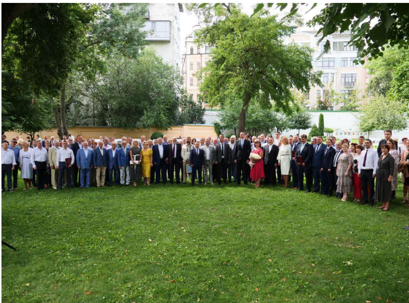
За повідомленнями Мінрегіону та Будівельної палати України